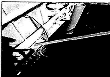
Fotografía 2: Punto de Muestreo